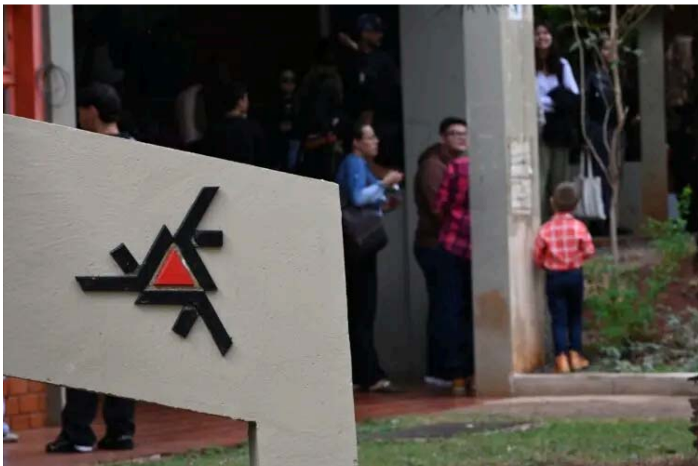
Inscrições para o Vestibular de Verão agora vão até 19 de novembro

As inscrições para o Vestibular de Verão 2024 da Universidade Estadual de Maringá (UEM) foram prorrogadas. Agora, os estudantes tem até o dia 19 de novembro para acessar o site da Comissão do Vestibular Unificado (CVU) ou o aplicativo 'Vestibular UEM' e se inscreverem nas dezenas de opções de cursos.