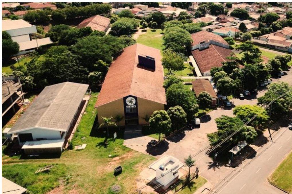
O Câmpus Regional de Umuarama

Em caso de dúvidas, é possível entrar em contato com a CVU/UEM pelo WhatsApp (44) 3011-5705 ou pelos endereços de e-mail vestibular@uem.br e pas@uem.br .